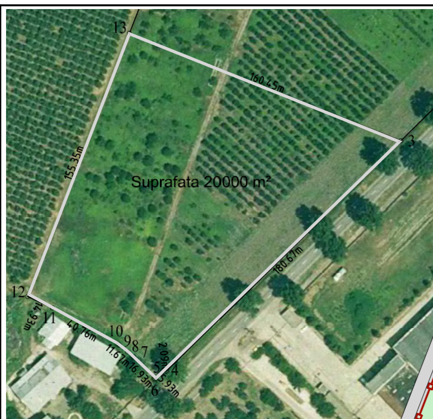
ORTHO POTO PLAN