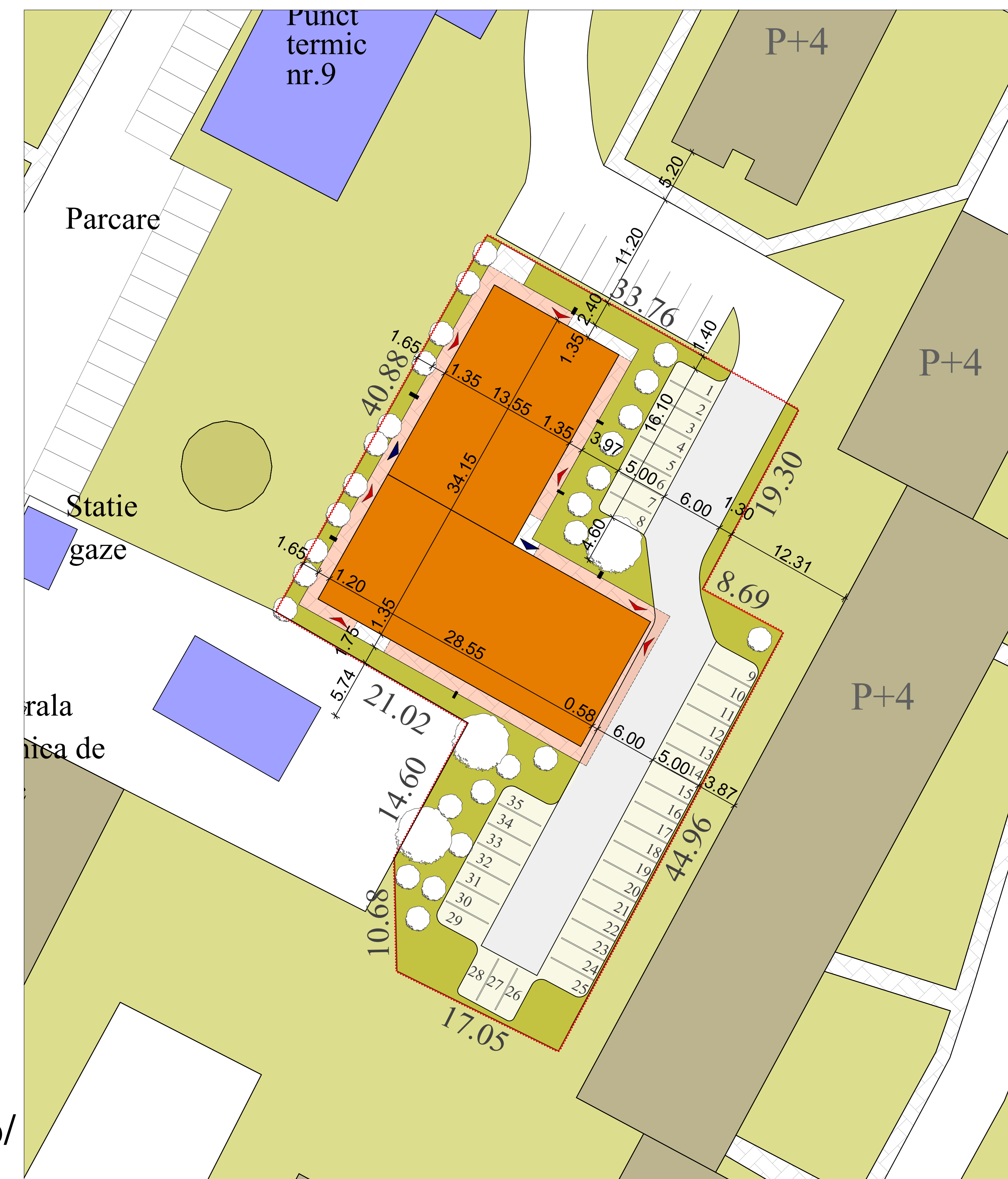
PLAN DE SITUATIE